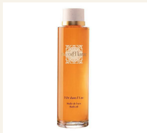
OLEJ DO KÚPEĽA

Jedinečná receptúra tohoto bohatého oleja do kúpeľa zabezpečí, že sa olej pri kontakte s vodou premení v saténovú mliečnu emulziu. Olej so vzácnou drevitou vôňou pripomína marocké kúpeľné rituály, po ktorých čas i priestor nadobudnú úplne inú dimenziu.